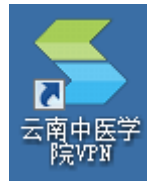
图 6 “云南中医学院 VPN”快捷方式

七、双击“云南中医学院 VPN”快捷方式，出现“VPN 登陆”窗口，如图 7 所示，选择“账号登陆”，输入“用户名”、“密码”，点击“登陆”，同样可以进入“云南中医学院 VPN 远程信息资源共享平台”界面，如步骤五中图 5 所示。