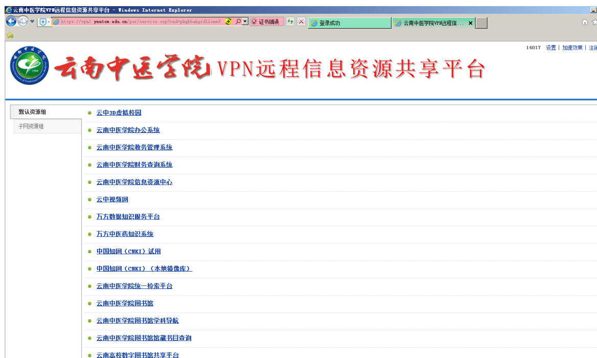
图 5 云南中医学院 VPN 远程信息资源共享平台界面

五、安装完毕后，即可进入“云南中医学院 VPN 远程信息资源共享平台”界面,如图 5 所示。在列表中选择需要访问的院内资源即可。