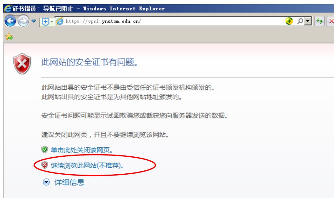
图 1 使用 IE7 及以上浏览器的证书告警页面

一、打开 Windows IE 浏览器，在浏览器地址栏中输入 VPN 访问地址 https://vpn1.ynutcm.edu.cn 或 https://221.213.101.197 ，然后单击回车键。弹出“证书告警”页面，如图 1 所示，此时点击“继续浏览此网站（不推荐）”