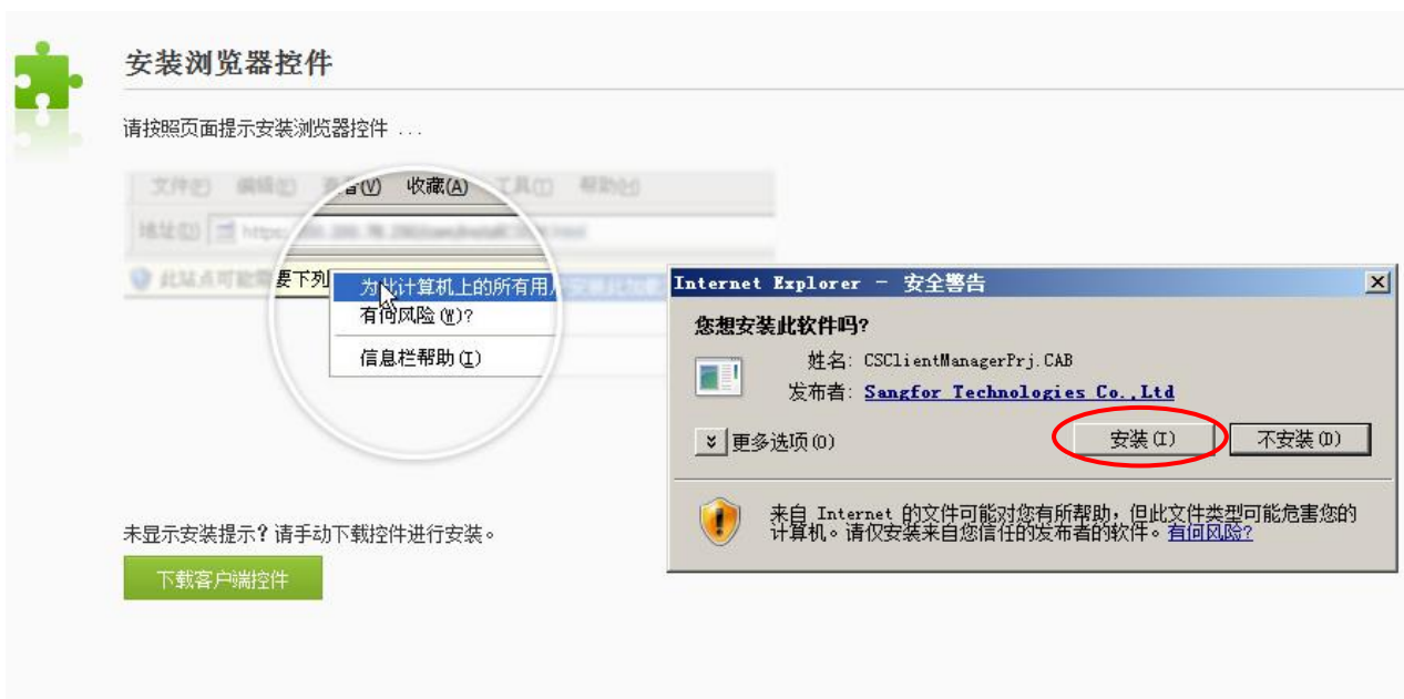
图 4 客户端控件安装界面

五、安装完毕后，即可进入“云南中医学院 VPN 远程信息资源共享平台”界面,如图 5 所示。在列表中选择需要访问的院内资源即可。