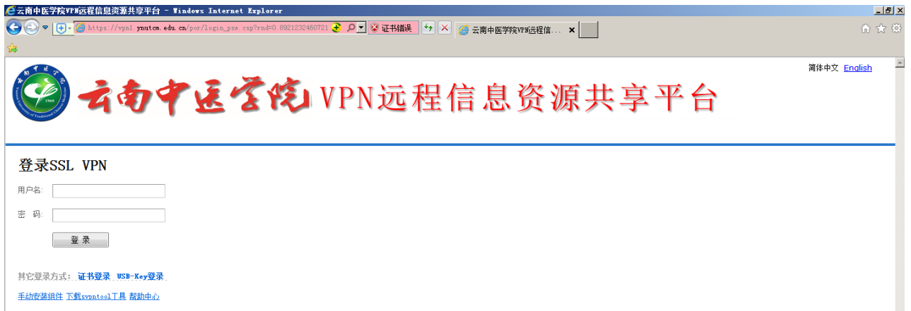
图 2 VPN 登陆界面

三、输入“用户名”和“密码”点击“登陆”，进入“云南中医学院 VPN 远程信息资源共享平台”，若是第一次使用新版 VPN 系统则会弹出“修改密码”界面，如图 3 所示，按照密码修改要求输入新密码，并点击确定修改。（密码修改要求：长度不小于 6 位；不允许包含用户名；不允许与旧密码相同；必须包含数字、字母）。